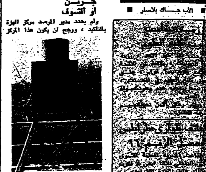
السيارة بعدما تحولت الى هيكل حديدي